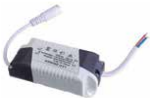
LED DRIVER 3-6W PARA PANEL EMPOTRABLE

Cod. 303947835071 Nº Parte. ISO-LEDDRIVER-3-6W Sub Empaque: 2 Unid.