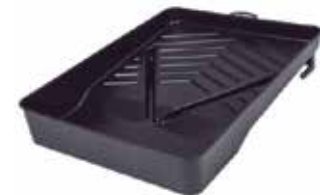
BANDEJA DE RODILLO DE 9"

Cod. 303947830694 Nº Parte. ISO-MAN-9 Sub Empaque: 1 Unid.