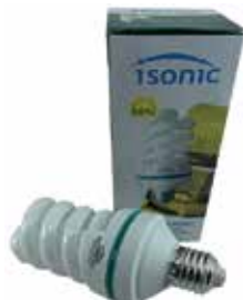
BOMBILLO AHORRADOR 26W TIPO ESPIRAL SÓCATE E27, 12 CM DE LARGO

Cod. 8606104261174 Nº Parte. ISO-BULB-E27-26W-10 Sub Empaque: 50 Unid.