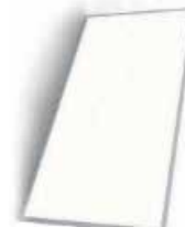
LÁMPARA LED PANEL 1200X600MM 72W 85-265V 6500K (INCLUYE ACCESORIOS) LUZ BLANCA

Cod. 639672646188 N° Parte. YM-6040 Sub Empaque: 1 Unid.