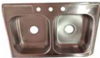
FREGADERO DE ACERO INOXIDABLE CROMADO S.S. 201, GROSOR 0,6MM, TAMAÑO 830X560MM

Cod. 303947832148 Nº Parte. ISO-CJSS-6006 Sub Empaque: 1 Unid.