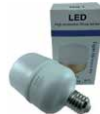
BOMBILLO INDUSTRIAL LED SÓCATE E40 50W 6500W 85-265V

Cod. 303947830892 N° Parte. ISO-LED-E40-36W Sub Empaque: 1 Unid.