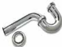
SIFÓN METÁLICO CROMADO DE 1-1/2"

Cod. 303947832186 Nº Parte. Sub Empaque: 1 Unid.