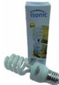
BOMBILLO AHORRADOR MINI 18W TIPO ESPIRAL SOCATE E27

Cod. 8606104261136 Nº Parte. ISO-BULB-E27-26W-12 Sub Empaque: 50 Unid.