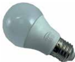
BOMBILLO HOGAR LED 9W 60MM E27 85-240V 6500K (LUZ BLANCA)

Cod. 303947835187 Nº Parte. ISO-LED-E27-7W-C Sub Empaque: 10 Unid.