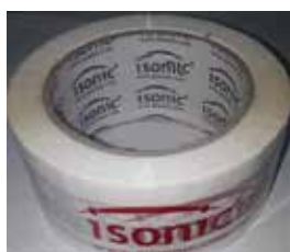
TIRRO (TEIPE) DE EMBALAR BLANCO CON LOGO ISONIC A PRUEBA DE AGUA, ANCHO 2", LARGO 100 MT, GROSOR 0,045MM

Cod.303947830724 N° Parte. ISO-TEI-TEF-50-30 Sub Empaque: 6 Unid.