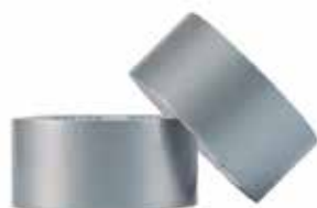
TIRRO (TEIPE) DUCTO GRIS 2" 30 MT

Cod.639672645754 N° Parte. ISO-MASK-25-30 Sub Empaque: 12 Unid.