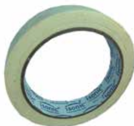
TIRRO (TEIPE) DE PINTAR BEIGE 3/4" 30 MT

Cod.303947830755 N° Parte. ISO-TEI-ELE-19-10 Sub Empaque: 10 Unid.