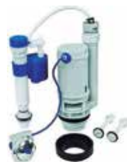
HERRAJE DE POCETA BOTON SUPERIOR DOBLE DESCARGA TANQUE BAJO VERTICAL

Cod. 639672650697 Nº Parte. ISO-BOT9030 Sub Empaque: 1 Unid.