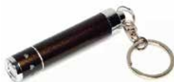
LLAVERO-LINTERNA MINI LED COLOR ROJO TAMAÑO:13MM*60MM, 1 BOMILLO LED, FUNCION: ON-OFF, BATERIA DE BOTON INTERNA, LOGO ISONIC, BOLSA EMPAQUE TRANSPARENTE

Cod. 639672646164 N° Parte. YM-2090-N Sub Empaque: 10 Unid.