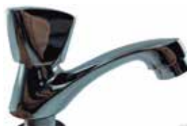
ISONIC: GRIFO DE AGUA FRÍA Y CALIENTE DE LAVAMANOS DE BRONZE Y CINCADO

Cod. 7594001880691 Nº Parte. GEN-C3002 Sub Empaque: 1 Unid.