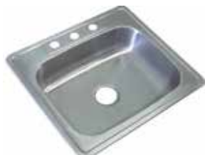
FREGADERO DE ACERO INOXICABLE CROMADO S.S. 201, GROSOR 0,5MM, TAMAÑO 480X480X150MM (DESAGÜE 390X340MM)

Cod. 303947832148 Nº Parte. ISO-CJSS-6006 Sub Empaque: 1 Unid.