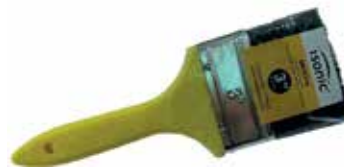
BROCHA PARA PINTAR 5" (127MM)

Cod. 303947834395 Nº Parte. ISO-BRO-100 Sub Empaque: 12 Unid.