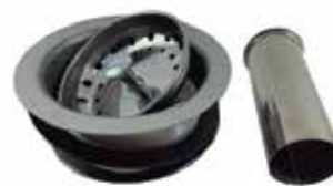
DESAGÜE DE DRENAJE DE FREGADERO DE 1-1/2" METÁLICO CINCADO

Cod. 303947834128 Nº Parte. ISO-JZ-280 Sub Empaque: 1 Unid.