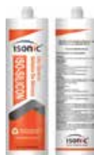
SILICON PROFESIONAL ACETICO USO GENERAL BLANCO (260ML)

Cod.639672646218 N° Parte. ISO-PACK-50-100 Sub Empaque: 6 Unid.