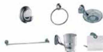
ACCESORIOS PARA BAÑOS 6 PIEZAS SANITARIAS CINCADO

Cod. 303947832094 Nº Parte. ISO-CJDD-104 Sub Empaque: 1 Unid.