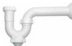
SIFÓN DE PLÁSTICO DE 1-1/2"

Cod. 303947832193 Nº Parte. ISO-CJMD4052 Sub Empaque: 1 Unid.