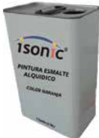
PINTURA ESMALTE ALQUIDICO COLOR BLANCO 1 GALON (3,78 L)

Cod. 303947834432 N° Parte. ISO-ESP-TEM-3 Sub Empaque: 1 Unid.