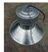
LÁMPARA DE GALPÓN LED 200W MULTIVOLTAJE 85-265V 380MM

Cod. 639672644313 Nº Parte. ISO-2B22C*1 Sub Empaque: 1 Unid.