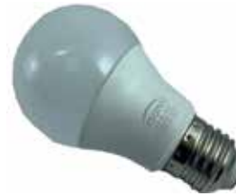
BOMBILLO HOGAR LED 12W 60MM E27 85-240V 6500K (LUZ BLANCA)

Cod. 8606100094349 Nº Parte. ISO-LED-E27-9W-C Sub Empaque: 10 Unid.