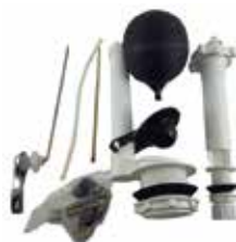
HERRAJE DE POCETA FRONTAL (MANILLA BALANCÍN DE METAL CINCADO)

Cod. 303947832063 Nº Parte. ISO-CJMP9049 Sub Empaque: 1 Unid.