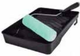
KIT DE PINTURA INCLUYE BANDEJA NEGRA, MANULLA Y RODILLO DE 9"

Cod. 303947834418 N° Parte. ISO-KITPIN-9 Sub Empaque: 1 Unid.