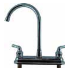
ISONIC: GRIFERÍA DE FREGADERO CUELLO CISNE DE 8" METÁLICO CINCADO, CUERPO DE BRONCE

Cod. 639672647826 Nº Parte. ISO-CJMT-P2001 Sub Empaque: 10 Unid.