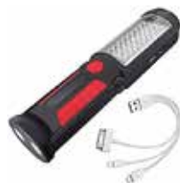
LAMPARA DE EMERGEN- CIA LED DE TRABAJO(150 LUMEN) & LINTERNA (100 LUMEN), BATE- RIAL RECARGABLE INTERNA, CARGADOR USB

Cod. 639672646171 N° Parte. YM-2090-R Sub Empaque: 10 Unid.