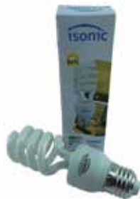
BOMBILLO AHORRADOR 26W TIPO ESPIRAL SÓCATE E27, 10 CM DE LARGO

Cod. 8606104261174 Nº Parte. ISO-BULB-E27-26W-10 Sub Empaque: 50 Unid.