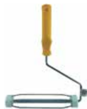
MANILLA DE RODILLO DE PINTAR 9"

Cod. 303947830687 Nº Parte. ISO-ROD-AC-9 Sub Empaque: 1 Unid.