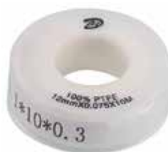
TEFLON DE SELLAR TUBERIA AGUA 19 MM X 0,75 MM X 10 MT (0,025GR/CM3)

Cod.303947830731 N° Parte. ISO-TEI-TEF-50-30 Sub Empaque: 1 Unid.