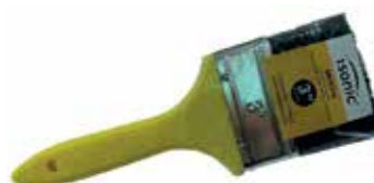
BROCHA PARA PINTAR 2" (50MM)

Cod. 303947834388 Nº Parte. ISO-BRO-25 Sub Empaque: 12 Unid.