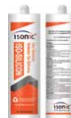
SILICON PROFESIONAL ACETICO USO GENERAL TRANSPARENTE (260ML)

Cod.303947834883 N° Parte. ISO-SIL-BLA260 Sub Empaque: 1 Unid.