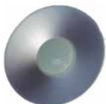
LÁMPARA BOMBILLO E27 DE GALPÓN LED 70W 220V 380MM MODELO ISO-2B40C*

Cod. 303947830960 Nº Parte. ISO-LEDPANEL-12W-120MM Sub Empaque: 1 Unid.