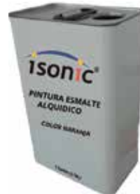
PINTURA ESMALTE ALQUIDICO COLOR NARANJA (RAL-2011) 1 GALON (3,78 L)

Cod. 639672645341 N° Parte. ISO-PIN-01 Sub Empaque: 1 Unid.