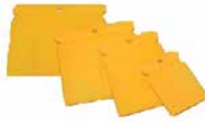
JUEGO DE 4 ESPATU- LAS DE PVC DE 2, 3, 4 Y 5 PULGADAS

Cod. 303947834418 N° Parte. ISO-KITPIN-9 Sub Empaque: 1 Unid.