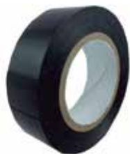
TEIPE AISLANTE DE ELECTRICIDAD NEGRO 3/4" X 0,2MM X 10MT

Cod.303947830755 N° Parte. ISO-TEI-ELE-19-10 Sub Empaque: 10 Unid.