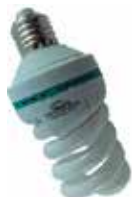
BOMBILLO AHORRADOR 85W TIPO ESPIRAL SÓCATE E27, 6500K

Cod. 8606104261150 Nº Parte. ISO-BULB-E27-18W Sub Empaque: 50 Unid.