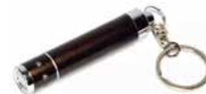
LLAVERO-LINTERNA MINI LED COLOR NEGRO TAMAÑO:13MM*60MM, 1 BOMILLO LED, FUNCION: ON-OFF, BATERIA DE BOTON INTERNA, LOGO ISONIC, BOLSA EMPAQUE TRANSPARENTE

Cod. 639672642227 N° Parte. ISO-XPE-REC Sub Empaque: 1 Unid.