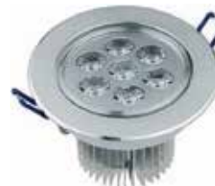
LÁMPARA LED EMPOTRABLE REDONDA 5" (120MM) 110V 12W (BORDE ALUMINIO)

Cod. 303947835118 Nº Parte. ISO-LEDDRIVER-18-24W Sub Empaque: 1 Unid.