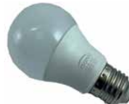
ISONIC: BOMBILLO HOGAR LED 7W 60MM E27 85-240V 3000K (LUZ CALIDA)

Cod. 639672644009 Nº Parte. ISO-BULB-E40-105W Sub Empaque: 1 Unid.