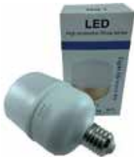
BOMBILLO INDUSTRIAL LED SÓCATE E27 50W 6500W 85-265V

Cod. 639672642814 N° Parte. ISO-LED-E27-50W Sub Empaque: 1 Unid.