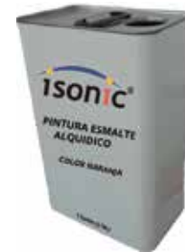
PINTURA ESMALTE ALQUIDICO COLOR VERDE (RAL-2011) 1 GALON (3,78 L)

Cod. 639672645358 N° Parte. ISO-PIN-2011 Sub Empaque: 1 Unid.