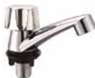
ISONIC: GRIFO DE AGUA FRÍA Y CALIENTE DE LAVAMANOS DE PLASTICO ABS

Cod. 303947832032 Nº Parte. ISO-CJMT1101 Sub Empaque: 10 Unid.