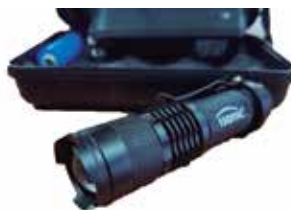
LINTERNA LED MODELO TIPO CREE XPE LUMENS 150 CON BATERIA RECARGABLE AA Y CARGADOR DE BATERIA (TAMAÑO 20*25*95MM)

Cod. 639672642234 N° Parte. ISO-XPE-SIN Sub Empaque: 1 Unid.