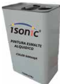
PINTURA ESMALTE ALQUIDICO COLOR AMARILLO TRAFICO 1 GALON (3,78 L)

Cod. 639672645365 N° Parte. ISO- PIN-6037 Sub Empaque: 1 Unid.