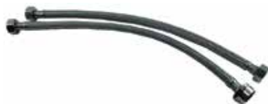
ISONIC: CANILLA DE ACERO CON TUERCA DE BRONZE TAMAÑO: F1/2" X M10 45CM (PARA POCETA LUJOSA)

Cod. 639672648267 Nº Parte. ISO-CJH-M2018010 Sub Empaque: 10 Unid.