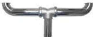
DRENAJE COLECTOR DE BRONCE CINCADO PARA FREGADERO

Cod. 303947832179 Nº Parte. ISO-CJD3194A Sub Empaque: 1 Unid.