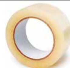
TIRRO (TEIPE) DE EMBALAR TRANSPARENTE A PRUEBA DE AGUA, ANCHO 2", LARGO 50 MT, EXTRA GRUESO 0,05MM

Cod.303947830748 N° Parte. ISO-TEI-TEF-19-10 Sub Empaque: 10 Unid.