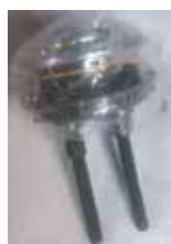
BALANCÍN BOTÓN SUPERIOR CROMADO DOBLE DESCARGA PARA POCETA LUJOSA ISO-9030 DIÁMETRO 7CM

Cod. 303947832155 Nº Parte. ISO-CJBA-F3100C Sub Empaque: 1 Unid.