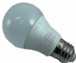
BOMBILLO HOGAR LED 9W 60MM E27 85-240V 3000K (LUZ CÁLIDA)

Cod. 303947831042 Nº Parte. ISO-LED-E27-9W-B Sub Empaque: 10 Unid.