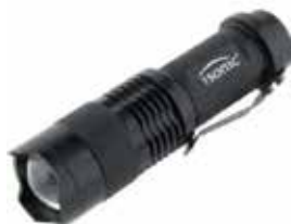
LINTERNA LED MODELO TIPO CREE XPE LUMENS 150 TAMAÑO 20*25*95MM (SIN BATERIA, REQUIERE 1 BATERIA DOBLE AA)

Cod. 303947830908 N° Parte. ISO-LED-E40-50W Sub Empaque: 1 Unid.