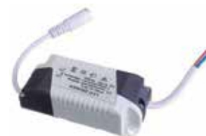
LED DRIVER 18-24W PARA PANEL EMPOTRABLE

Cod. 303947835101 Nº Parte. ISO-LEDDRIVER-12-18W Sub Empaque: 1 Unid.